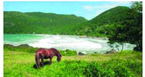
Die Insel Florianópolis hat auch romantische Ecken zu bieten, wie hier im Süden des Eilandes.