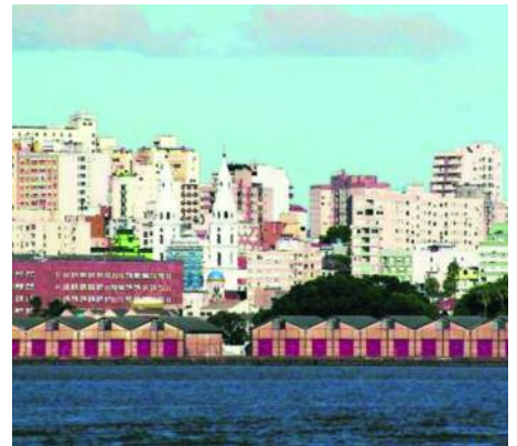
Porto Alegre, mit fast 1,5 Millionen Einwohnern die Hauptstadt des brasilianischen Bundesstaates Rio Grande do Sul, ist WM-Spielort 2014.

Auch in der Markthalle Mercado Publico mitten im Stadtzentrum dreht sich alles um Essen und Trinken. Fleisch, Meeresfrüchte, Obst und Gemüse werden feilgeboten und natürlich der überaus wichtige Erva Mate für den Chimarrão. Ein Händler zeigt, dass der Tee aus der Mate-Pflanze nicht etwa aus der Tasche genossen wird. Nein, es muss ein ausgehöhlter und getrockneter Flaschenkürbis sein, in dem der Tee mit heißem Wasser aufgegossen und dann mit einem Bomba, einem Strohhalm, getrunken wird. Er schmeckt bitter, aber der Tee soll ge-