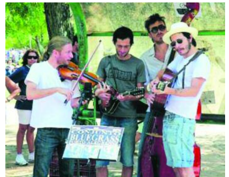
Straßenmusiker im Zentrum von Florianópolis.

sund sein, blutdrucksenkend und intelligenzfördernd. Bewiesen ist das freilich nicht.